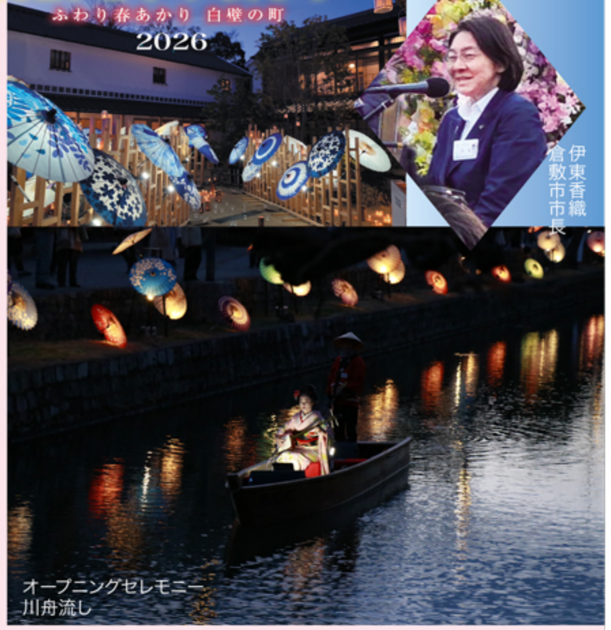
伊東香織 倉敷市市長