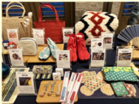
倉敷の物産が並びます。