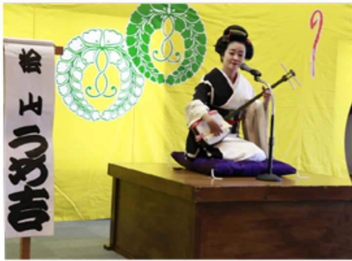
ご参加いただいた皆様 ありがとうございました。