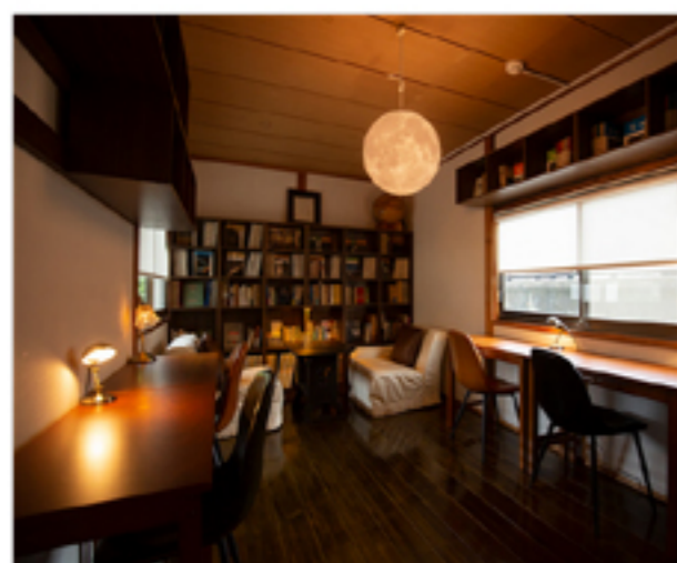
トークショー会場 café 「星の光の澄みわたり」 ASTORO Bar

※林の本家は途絶えうめ吉の家は分家。もし本家が途絶えていなければ14代目当主と「はとこ」になります。