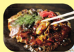
名物「カキオコ」 (牡蠣のお好み焼き)