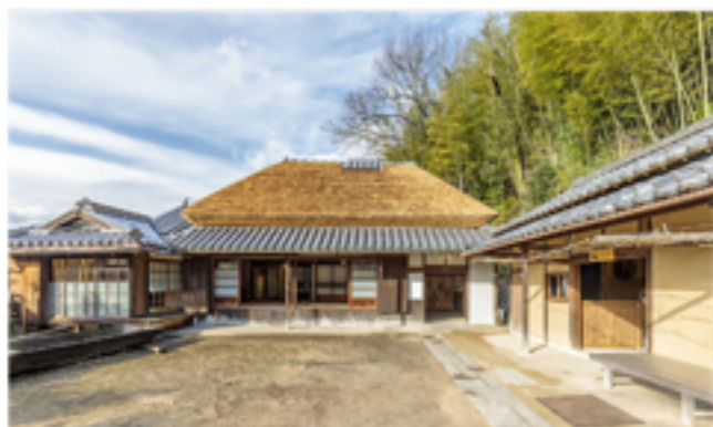
夢二が16歳まで過ごした茅葺きの生家には素描、版画などが展示されています。

明治17年、岡山に生まれた竹夢二は18歳で上京し、雑誌や新聞にコマ絵を寄稿するところから画家としての道を歩み始める。やがて「夢二式美人」といわれる独特の情感をたたえた美人画のスタイルを確立、叙情あふれる画集を次々と発表して人気作家となった。また、雑誌の表紙や広告から、千代紙、便箋、封筒、うちわ、半襟、浴衣などの日用品まで幅広くデザインを手がけ、今でいうイラストレーター、グラフィックデザイナー、あるいはアートディレクターの先駆者といえる。