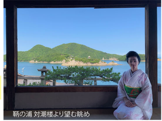
鞆の浦 対潮楼より望む眺め