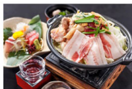
夕食:名物美酒鍋イメージ