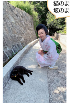
尾道は猫のまち 坂のまち

尾道は岡山市と広島市のほぼ中間に位置し、瀬戸内海(対岸の向島との間はその狭さから尾道水道と呼ばれる)に面し、古くから海運による物流の集散地として繁栄しました。「坂の街」「文学の街」「映画の街」として知られ、文学では林芙美子、志賀直哉などが居を構え、尾道を舞台とした作品を発表。映画では小津安二郎監督の『東京物語』が尾道で撮影され、大林宣彦監督の『転校生』『時をかける少女』『さびしんぼう』は「尾道三部作」として、尾道を有名にしました。