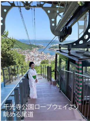
千光寺公園ロープウェイより眺める尾道

10/21(金) 千光寺公園～尾道 散策 往復ロープウェイ ※散策される方は復路をお歩きください。