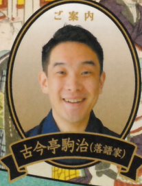
ご案内 古今亭駒治(落語家)