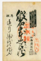
『仮名手本忠臣蔵』 『道行旅路の嫁入』床本表紙 (国立劇場所蔵)