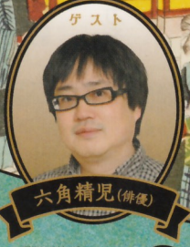
ゲスト 六角精児(俳優)